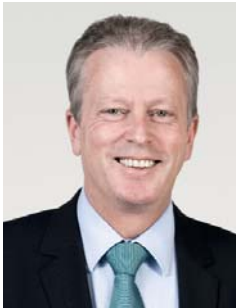
Dr. Reinhold Mitterlehner Bundesminister für Wirtschaft, Familie und Jugend

Lebenslanges Lernen ist in der heutigen Wissensgesellschaft ein essentieller Wettbewerbsfaktor. In diesem Sinne zeichnet der Staatspreis KNEWLEDGE Personalentwicklungsmaßnahmen aus, die im weitesten Sinn lebensbegleitendes Lernen im beruflichen Kontext unterstützen. Das können die gesamten Personal- bzw. Organisationsentwicklungsaktivitäten in größeren Unternehmen ebenso sein wie gezielte Trainings in kleineren Betrieben.